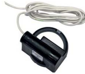
МОДУЛЬ ИМПУЛЬСНЫЙ AT-MBUS-NE-01 / AT-MBUS-NE-03