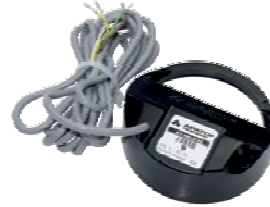
МОДУЛЬ ИМПУЛЬСНЫЙ AT-MBUS-NE-02